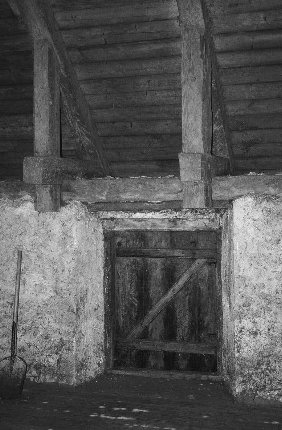
Detalj från den överdimensionerade takkonstruktionen vid en av originalluckorna på höloftet.

fester. Gästerna roade sig med varpakastning i parken. Målpinnar sägs vid något tillfälle ha varit öppnade champagneflaskor.