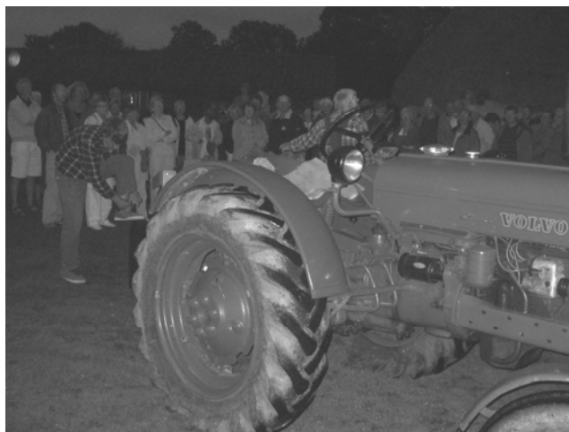
Husbonden, drängen och den nya traktorn i Gretas Mupedn

Ansökan handläggs av kommunens regionala utvecklingsteam som har föreslagit att vi försöker inlemma förstudien i en utvecklingsåtgärdsplan som kommunen för närvarande genomför bland ett antal besöksmål på Gotland. Denna satsning leds av ett konsultföretag i Stockholm och diskussioner förs nu med detta företag om förutsättningarna ekonomiskt och kompetensmässigt för att kunna tillgodose Bottarves behov inom ramen för detta projekt. Preliminärt har vi med detta konsultföretag diskuterat en tidplan som innebär att ett förslag skall vara färdigt i mitten av våren för att kunna behandlas av styrelserna för hembygdsföreningen och den ekonomiska föreningen för att sedan kunna behandlas på den ekonomiska föreningens ordinarie stämma i juni nästa år. Parallellt kommer under våren kontakter att tas med tänkbara finansörer.