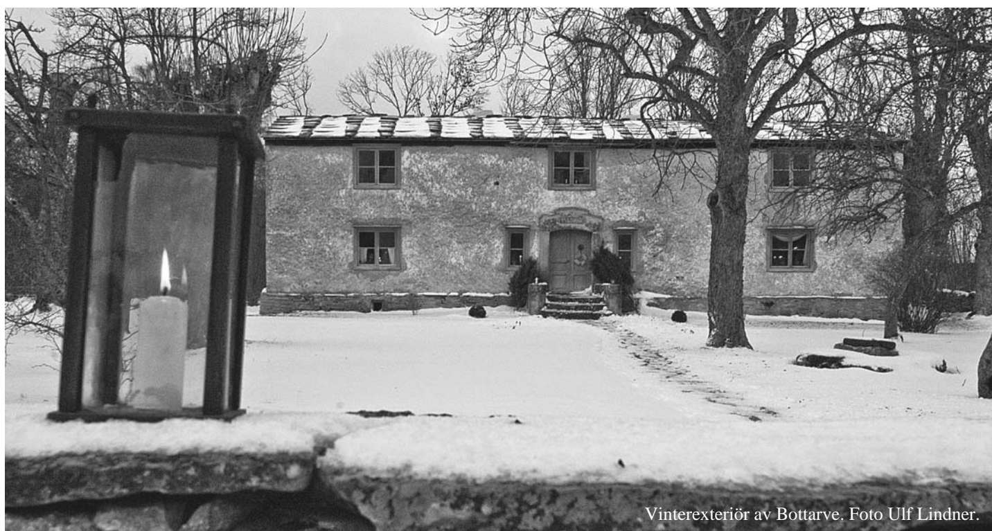
Vinterexteriör av Bottarve.