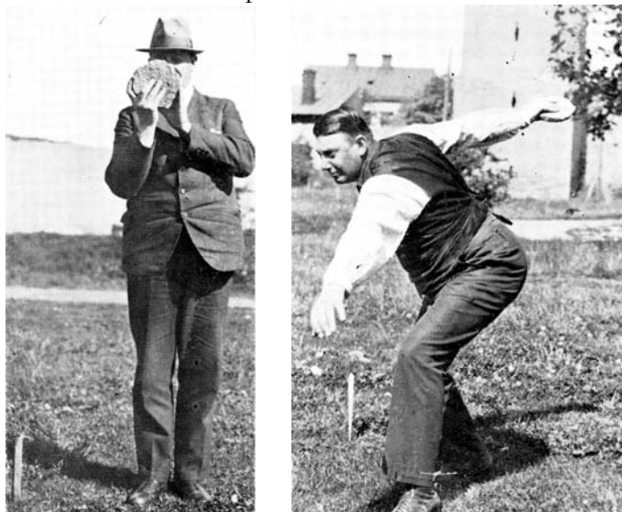
Instruktionsbilder ur häfte om varpkastning från 1933.

minst sagt, varierande sammansättning av kastare. Och varierande skicklighet. Så kombinera gärna den traditionella Bottarvefesten med ett besök på varpaplanen! Som tävlande eller enbart som åskådare. Det finns folk på plats som gärna förklarar reglerna för dem som aldrig tidigare sett en varpa kastas. Grundregel: Varpan kastas tjugo eller femton meter, beroende på ålder och kön. Den tävlande går sedan och tar upp sin varpa och kastar tillbaka den igen. Den som oftast kastar närmast pinnen vinner. Svårare är det inte.