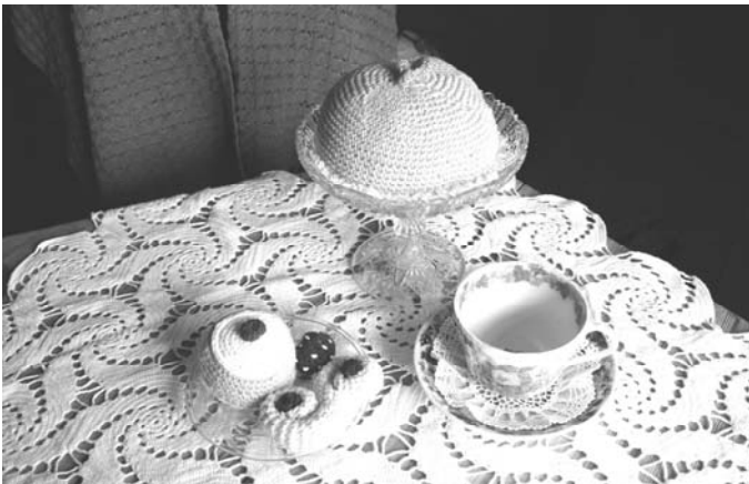
Årets utställning visar inte bara Vådligt och Vackert Virkat, utan även Sött Virkat.

VÅDLIGT VACKERT VIRKAT - njut av virkningens lustar! Utställningen är fylld av föremål insamlade från Storsudret. Virkningen är troligen ett gammalt hantverk men utforskat.